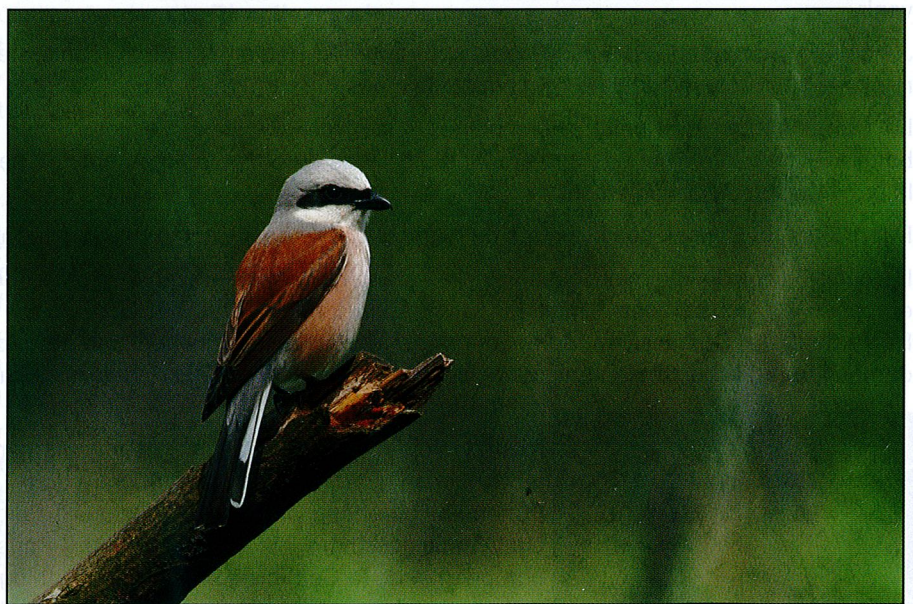
La pie-grièche écorcheur fait partie des espèces protégées par le projet.

Le projet qui vient de démarrer étudie et met en place des mesures de conservation pour quelques espèces particulièrement touchées par ce changement : trois chauves-souris (le petit et le grand rhinolophe ainsi que le vespertilion à oreilles échanquées), un amphibien (le triton crêté), une libellule (l'agrion de mercure) et un oiseau (la pie-grièche écorcheur). Ces six espèces sont considérées en danger à l'échelle de la Wallonie.