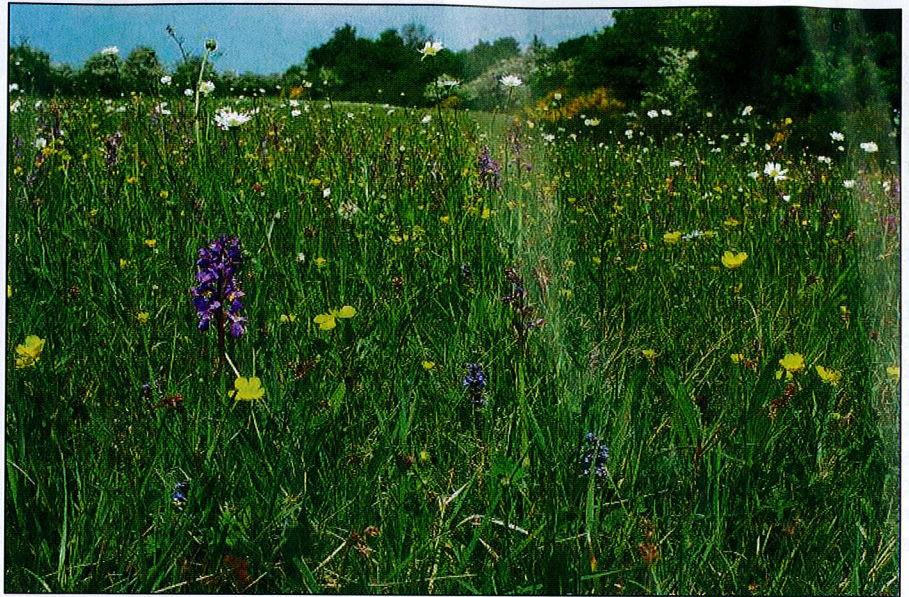
Les prairies maigres regorgent de fleurs menacées par les engrais.

L'action la plus importante du projet sera de restaurer biologiquement 150 hectares de prairies dans 10 sites Natura 2000 entre Chimay et Rochefort (sur un total de 24000 ha que couvrent ces sites). De nouvelles prairies verront donc le jour après déboisement de peuplements exotiques (résineux, peupliers,...) et semis de prairie. La restauration des prairies comprendra également le semis de graines ou l'épandage de foin provenant d'une prairie de haute valeur biologique. La plupart de ces prairies restaurées seront remises aux agriculteurs de la région afin qu'ils les gèrent au mieux. En général, la gestion qui permettra de conserver le milieu ouvert consistera en opérations de fauchage, éventuellement couplées à un pâturage extensif.