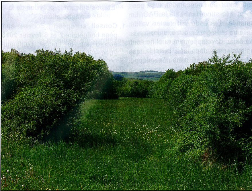
Les haies, refuge de biodiversité, structurent les bocages

E n collaboration avec Virelles-Nature, Natagora démarre un nouveau projet : le LIFE « Prairies bocagères ». 150 hectares de prairies vont être restaurés dans 10 sites Natura 2000 entre Chimay et Rochefort avec le soutien de la Commission Européenne.