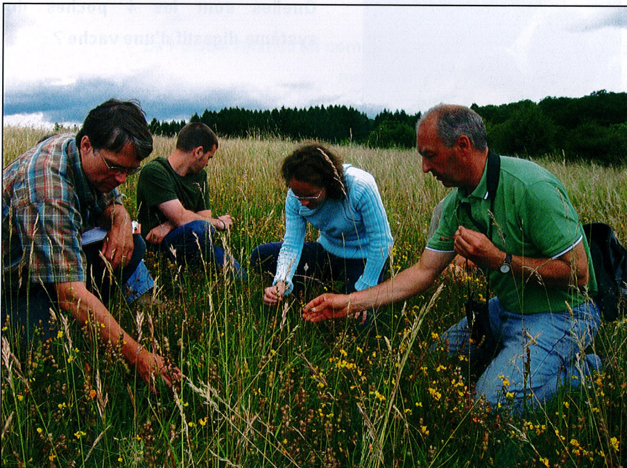
La restauration des milieux se doit d'aller de pair avec leur étude approfondie (conseillers MAE en expertise de prairie de haute valeur biologique – MAE8)